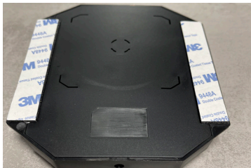
Lademodul skjult under benkeplaten