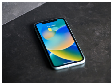
Her limes QiPOWER 3.0 under platen